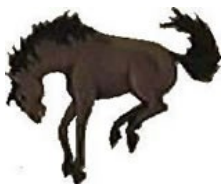
Olga Reed School, Los Alamos