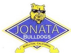
Jonata Middle School, Buellton