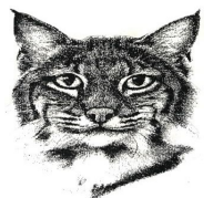
College/Santa Ynez School